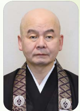
新教務所長・輪番