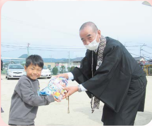
子どもたちへの記念品の贈呈

平成5年より毎年、山口県内の社会福祉協議会等に福祉車輛、軽自動車を贈呈しております。今回は社会福祉法人 防府海北園へお贈りし、延べ60台の車輛を各社会福祉協議会及び福祉施設にて活用していただくこととなりました。昨年度も皆さまに多大なご協力を賜りましたこと、厚く御礼申し上げます。当日は車両の贈呈に加え、教区